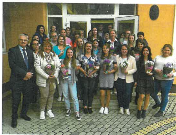
Nőnap alkalmából köszöntöttük a hölgy dolgozókat