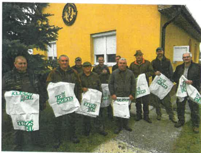
TESZEDD szemétygyűjtő akció a Hoportyó Vadásztársaság szervezésében