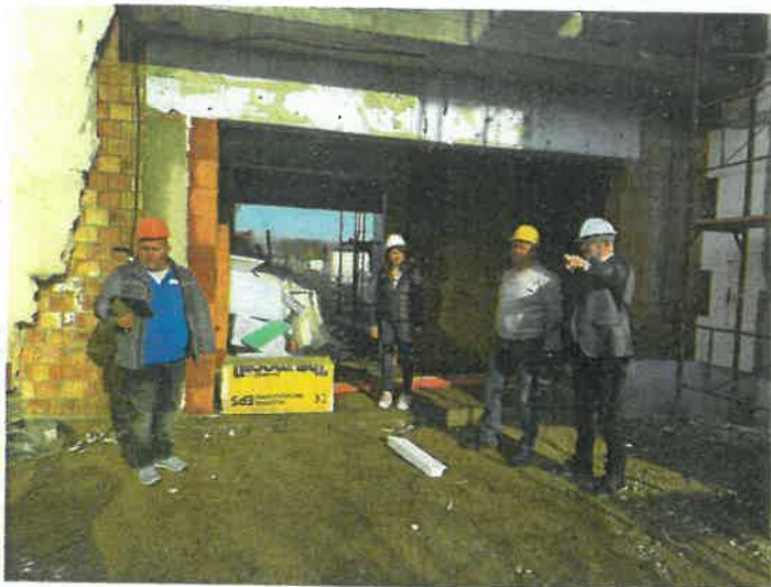
Jól haladnak a munkálatok az új óvoda épületénél