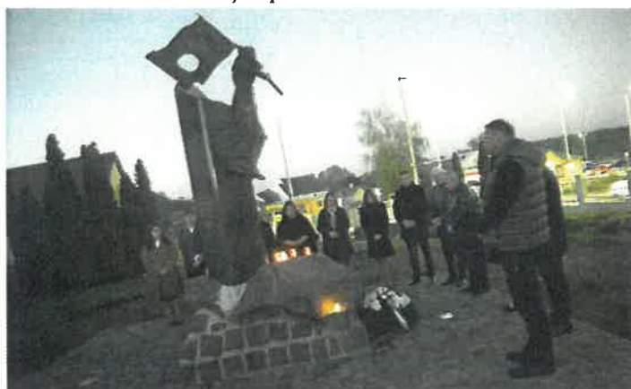
Okt. 23-ai megemlékezés