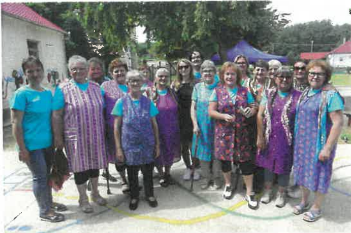
Az Idősek Nappali Ellátása fellépés után