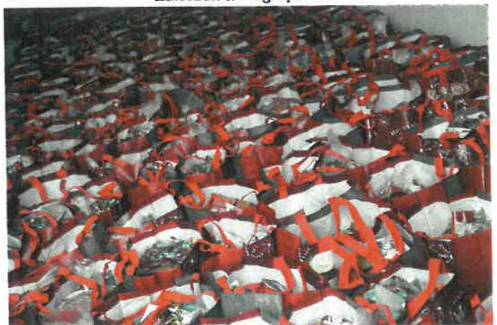
Idés is kiosztásra kerül az Önkormányzat Karácsonyi csomagja