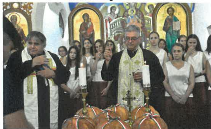
Új kenyér szentelés