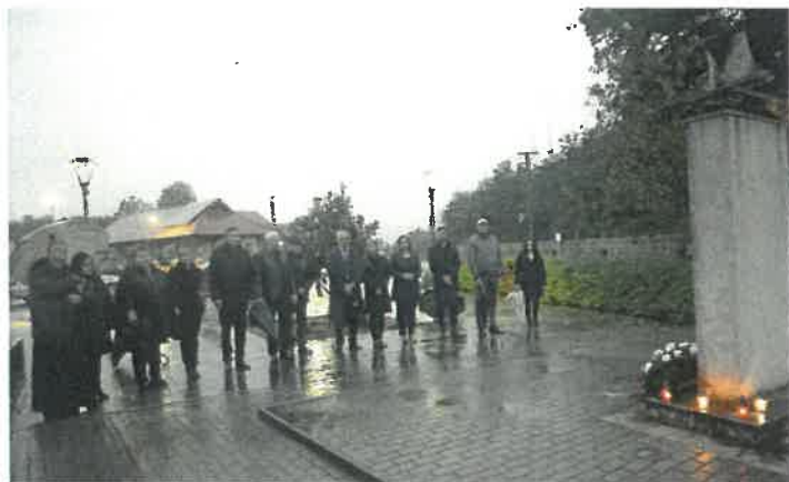
Okt. 6-ai megemlékezés