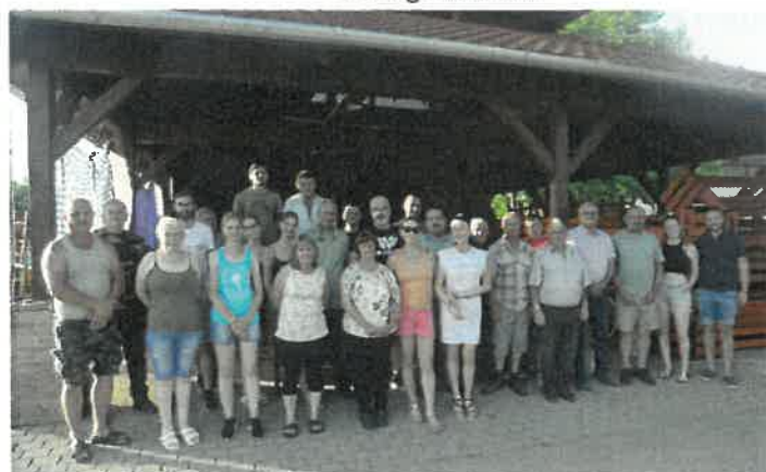
Városunk polgárőreinek közgyűlésén