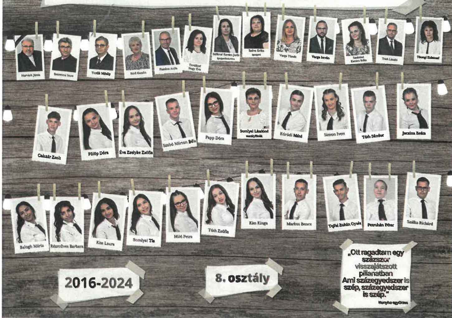
A Vántus István Általános Iskola elballagott diákjai