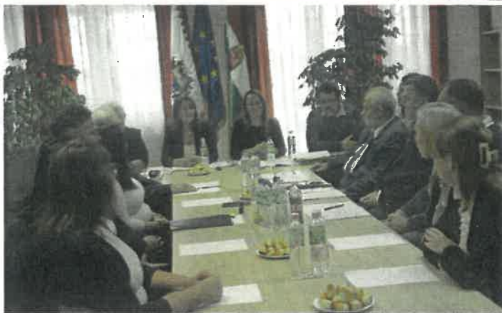
Megalakult Nyírbogát Város Önkormányzatának új Képviselő-testülete