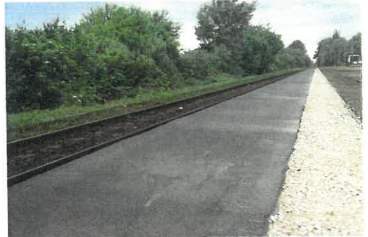
Elkészült a magasperon.