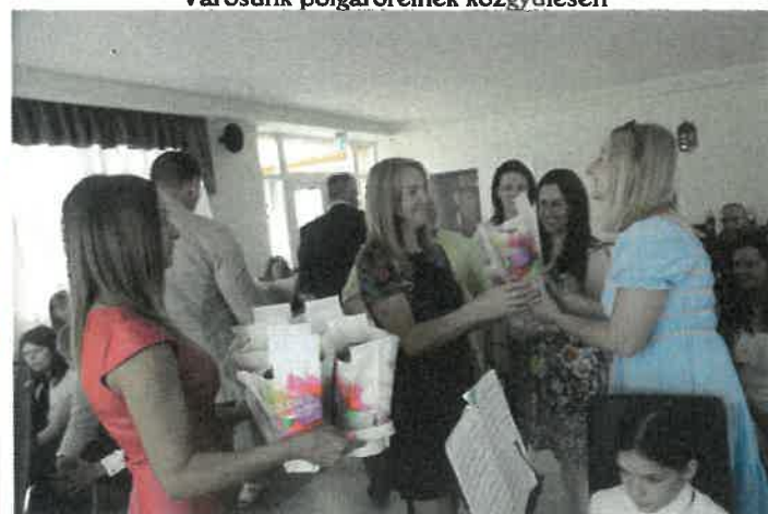
Pedagógusnap alkalmából köszöntöttük a város oktatási, nevelési intézményeinek dolgozóit