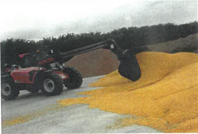
A Bászna Gabona az első betelepülő a Nyírbogáti Ipari Parkba.

Önkormányzatunk idén is meghirdette a szociális alapú tűzifa támogatási programját. A kérelmeket a megfelelő nyomtatványon November 18. napjáig lehetett beadni. Ez a természetbeni juttatás annak a személynek vagy családnak adható, aki időszakosan, vagy tartósan fennálló létfenntartási problémákkal küzd, és az egy főre jutó havi jövedelem összege nem haladja meg a 130.000 Ft-ot, 65 éven felüli egyedül élő személy esetén a 150.000 Ft-ot. A támogatás ugyanazon lakott ingatlanra csak egy jogosultnak állapítható meg, függetlenül a lakásban élő személyek és háztartások számától. A házhozszállításról az önkormányzat saját költségén gondoskodik. A tűzifa kiosztásának határideje 2025. Február 15., de önkormányzatunk igyekszik idén is minél hamarabb az igénylők rendelkezésére bocsátani.