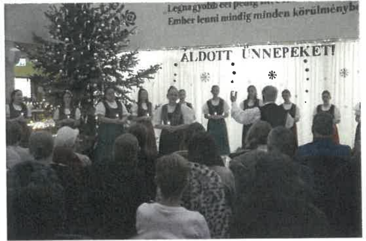
A Cantemus Kórus varázslatos Adventi koncertet adott Nyírbogáton