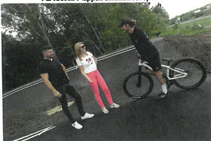
Elkészült a pumpapálya