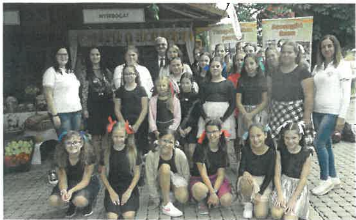
Közfoglalkoztatási kiállításon léptek színpadra a nyírbogáti diákok